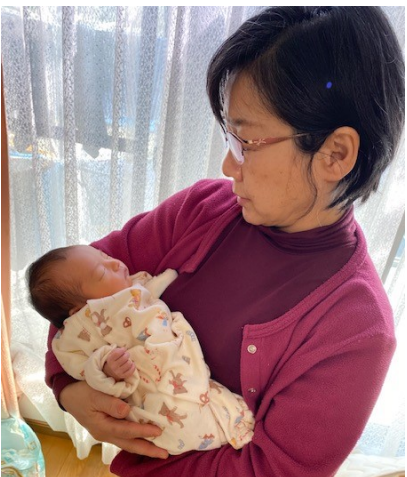
退院してすぐの2600gのはなちゃんと私

*覇権主義とは：特定の国家あるいは政府が「自国の影響力拡大のために、軍事的、経済的、政治的に強大な力にものを言わせて、他国に介入し、他国の主権を侵害・支配すること（ウィキペディアより）」